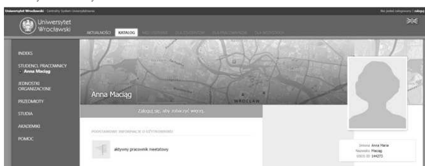
Rysunek 3. Wygląd zakładki osobistej osoby po wpisaniu numeru albumu dla osoby niezalogowanej do systemu.