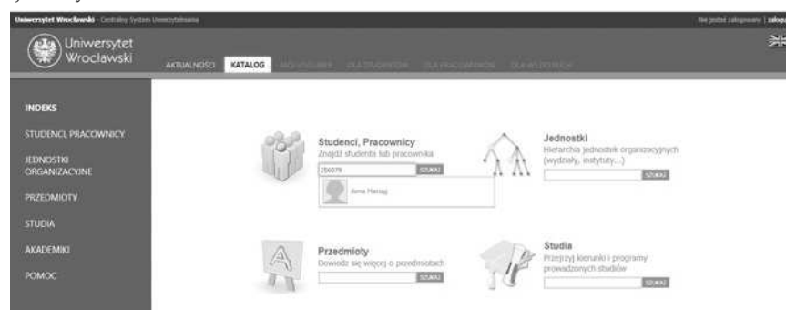
Rysunek 2. Wyszukanie osoby po wpisaniu numeru albumu dla osoby niezalogowanej do systemu.

Po wpisaniu numeru albumu w polu „studenci, pracownicy” pojawia się profil danej osoby.